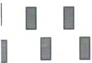
Схема рассадки в столовой по классам